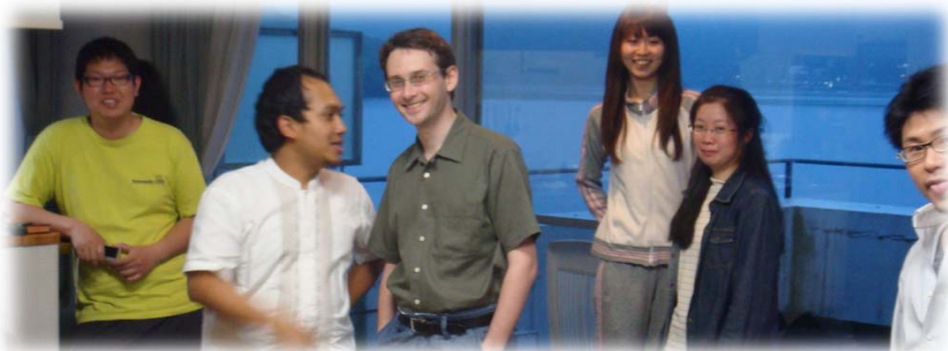
榛名湖畔での新歓2011